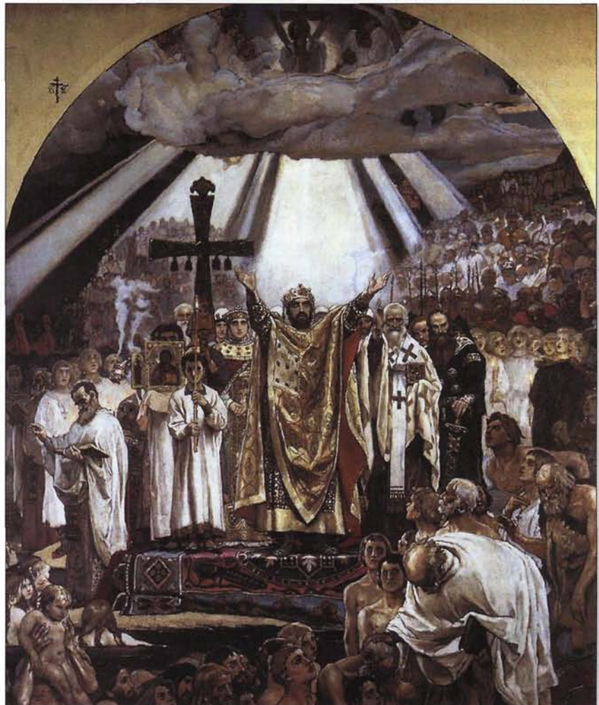
В.М. Васнецов. Крещение Руси. 1885–1896.

Но, в сущности, для понятия механизма таможенных отношений важно даже не это: получить дополнительные возможности и стимулы развития, таможенная система моментально отреагировала. Начала развиваться ускоренными темпами. Порой вне зависимости от воли» Сильных мира сего». Любая революционная идея, материализуясь, работает по