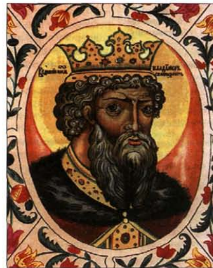
Святой равноапостольный князь Владимир Святославович (Владимир Мономах)

Улыбнулся летописец так, как один улыбаться умел – одними глазами.