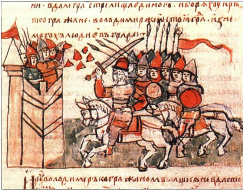
Осада Корсуня (Херсонеса) войском князя Владимира. Миниатюра из Радзивилловской летописи. 13 век

дей своих в земли наши направь, Пусть убедятся, сколь великолепны наши храмы, величественны службы в них и могущественна вера. От римской веры немногим отличается, но более честная она и красивая. Пусть услышат люди твои пение церковное и службу архиерейскую, предстояние дьяконов и клир увидят.