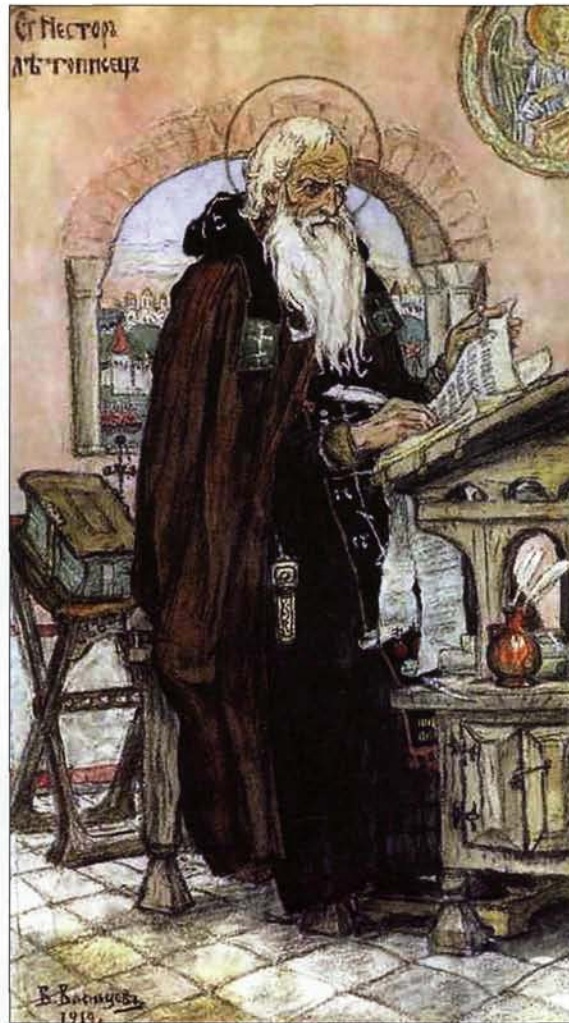
В. М. Васнецов. Летописец Нестор. Акварель, 1919

К острову Бренейяр, что в устье реки Гетаельв, подходили корабли с головами драконов. Здесь уже были «Бык океана», «Ворон ветра», «Вепрь» и другие славные имена, наводившие ужас на многих купцов. Но только не на него – купца из Кордовы Ибрагима ибн Якуба. Он-то умел ладить с кем угодно, учитывая специфику товара этого достойного подданного арабского халифата. Ибрагим был работником, а потому и радо-