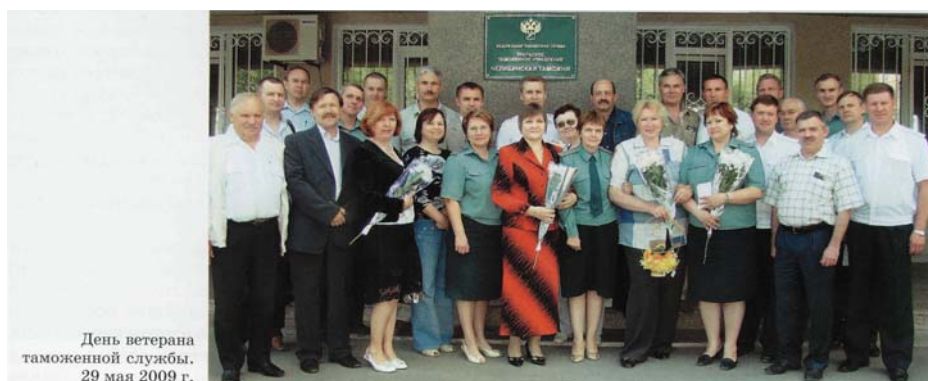
День ветерана таможенной службы. 29 мая 2009 г.