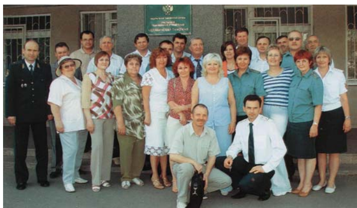
Ветераны Челябинской таможни. 2006 г.

Ежегодно 29 мая - в День ветеранов таможенной службы - проводится их чествование. Внимание к ветеранам не только делает жизнь таможни более насыщенной и плодотворной, но и сохраняет высокое, необходимое чувство причастности к ее сегодняшним делам тех, кто ушел на заслуженный отдых.