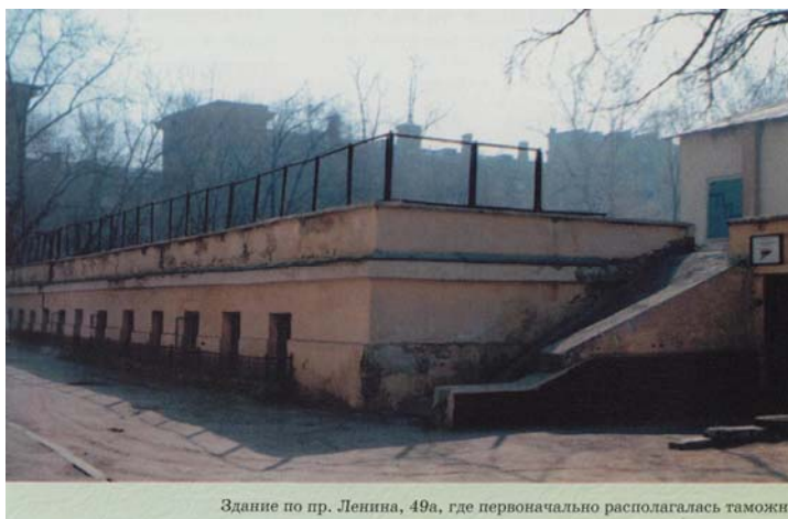
Здание по пр. Ленина, 49а, где первоначально располагалась таможня

Между тем условия труда таможенников явно не соответствовали поставленным перед ними задачам. Работать пришлось в полуподвальном помещении приспособленного под таможню здания, не хватало счетно-вычислительной и компьютерной техники, слабой была материально-техническая база: собственного гаража у таможни не было, выделенные три автомашины не могли обеспечить в должной мере жизнедеятельность службы, отсутствовали таможенные склады для хранения задержанных грузов и т.д.