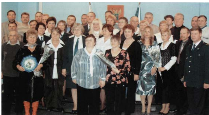
На встрече с ветеранами. 29 мая 2008 г.